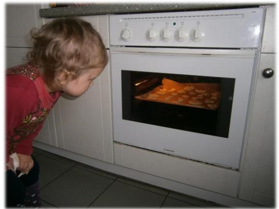
Neugier und Experimentierfreude