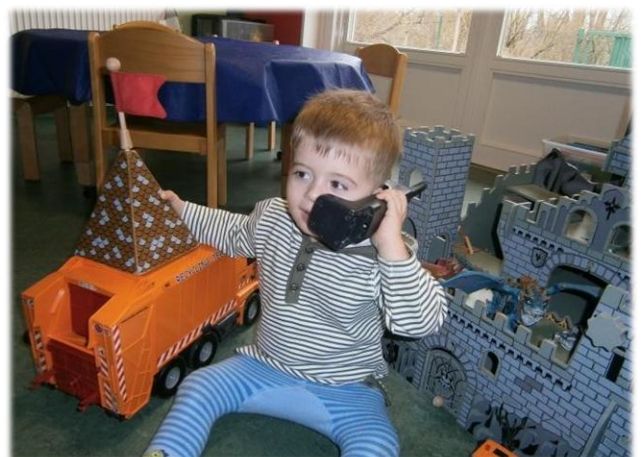
Regeln verstehen und einhalten, variieren und neu erfinden