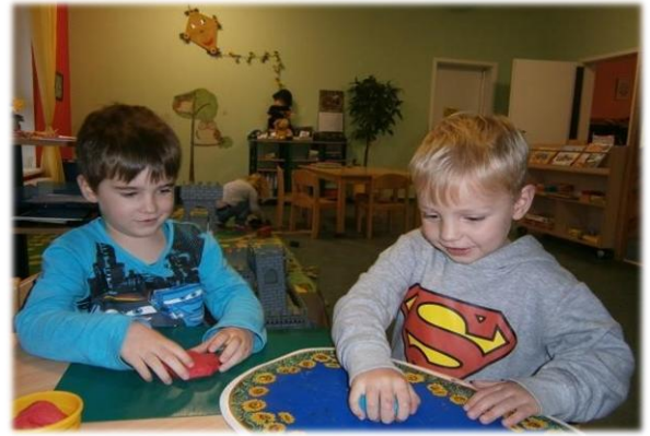
Kommunizieren, Entscheidungen treffen, sich durchsetzen