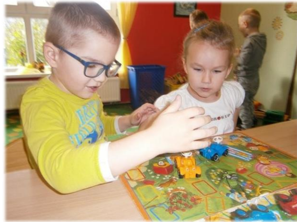
Kooperieren, Abgeben, Teilen, um Hilfe bitten und Hilfe annehmen