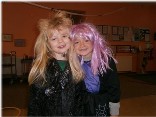
Humor, Kreativität, Fantasie