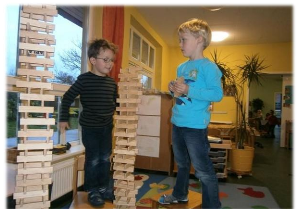
Physikalische Grundgesetze, Planen, Organisieren, Improvisieren