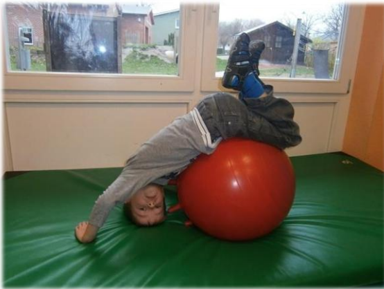
Geschicklichkeit und Reaktionsvermögen